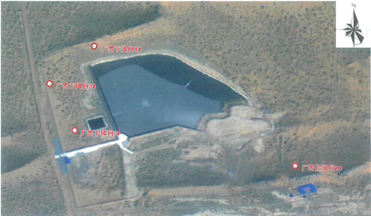
图例：○表示无组织排放废气检测点位