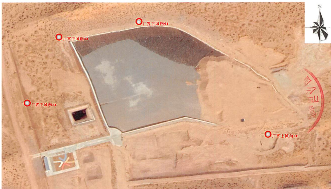
图例：○表示无组织排放废气检测点位