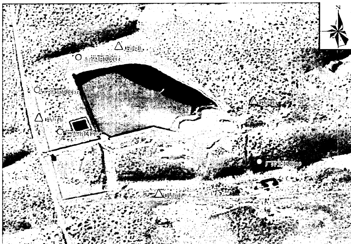
图例：○表示无组织排放废气检测点位 △表示厂界噪声检测点位