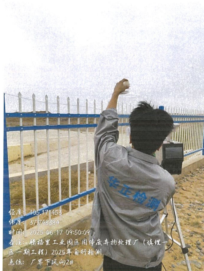
图 2 现场采样

样品采集、保存、运输和检测分析过程严格按照相关技术规范进行, 满足要求(采样见图 2)。