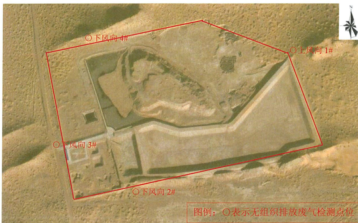
图 1-1 检测点位图