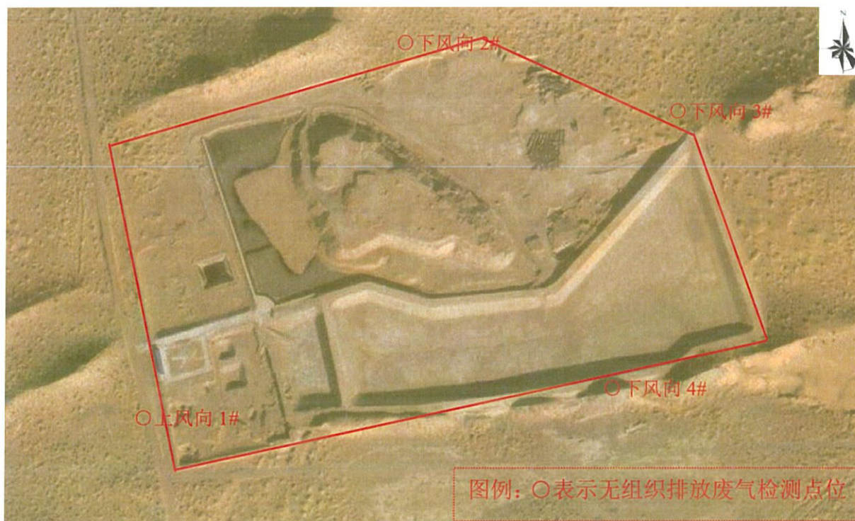
图 1-2 检测点位图