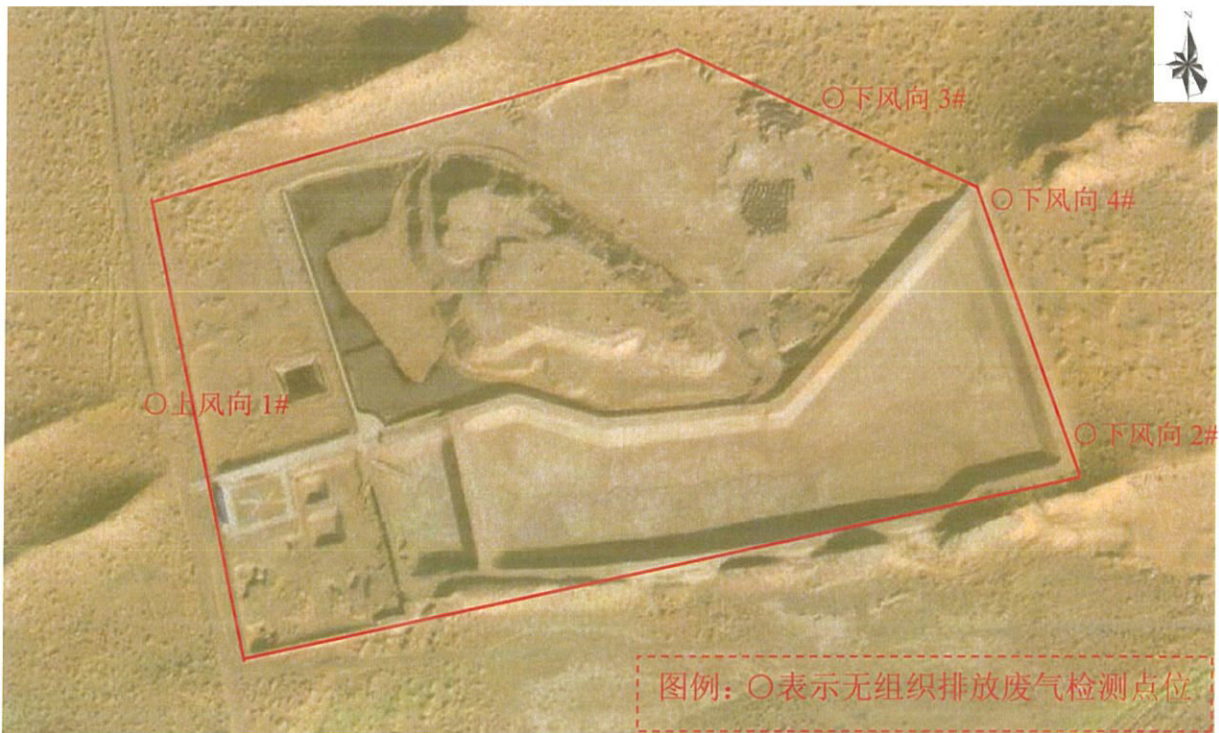
图 1-2 检测点位图 (2025 年 9 月 15 日)