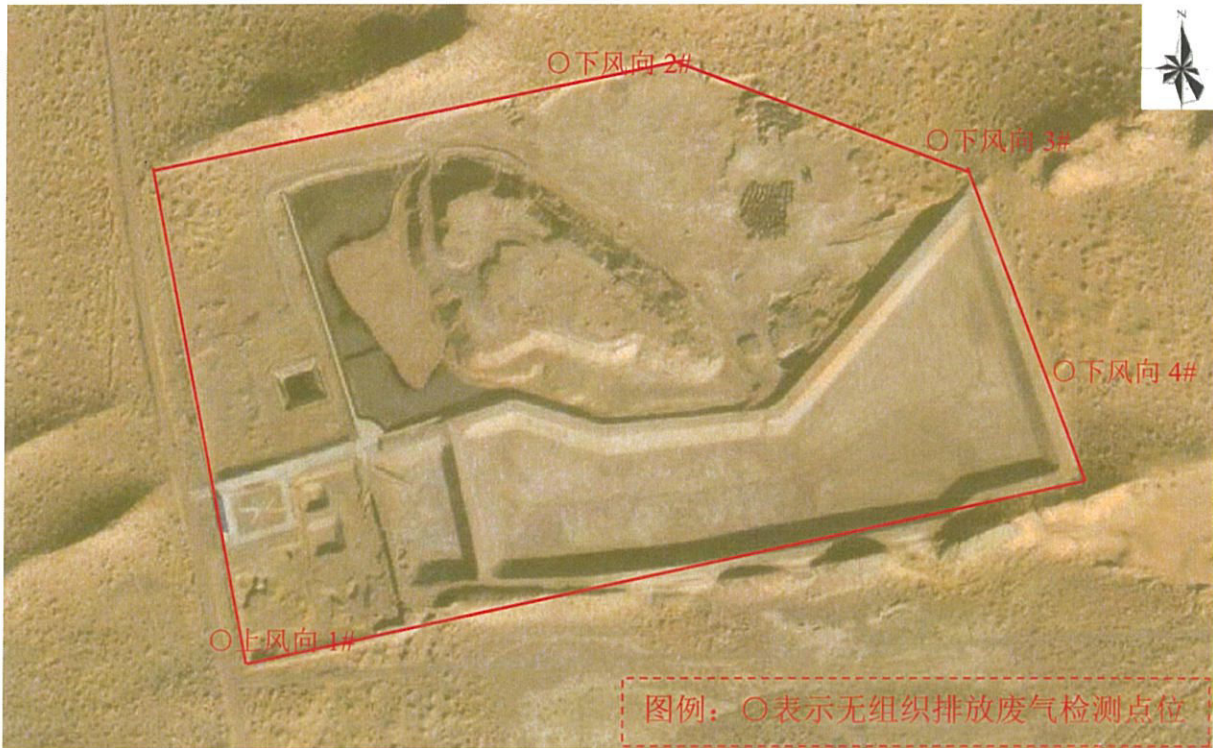
图 1-1 检测点位图 (2025 年 9 月 14 日)