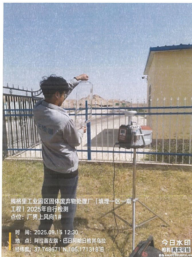
图 2 现场采样

样品采集、保存、运输和检测分析过程严格按照相关技术规范进行，满足要求(采样见图 2)。