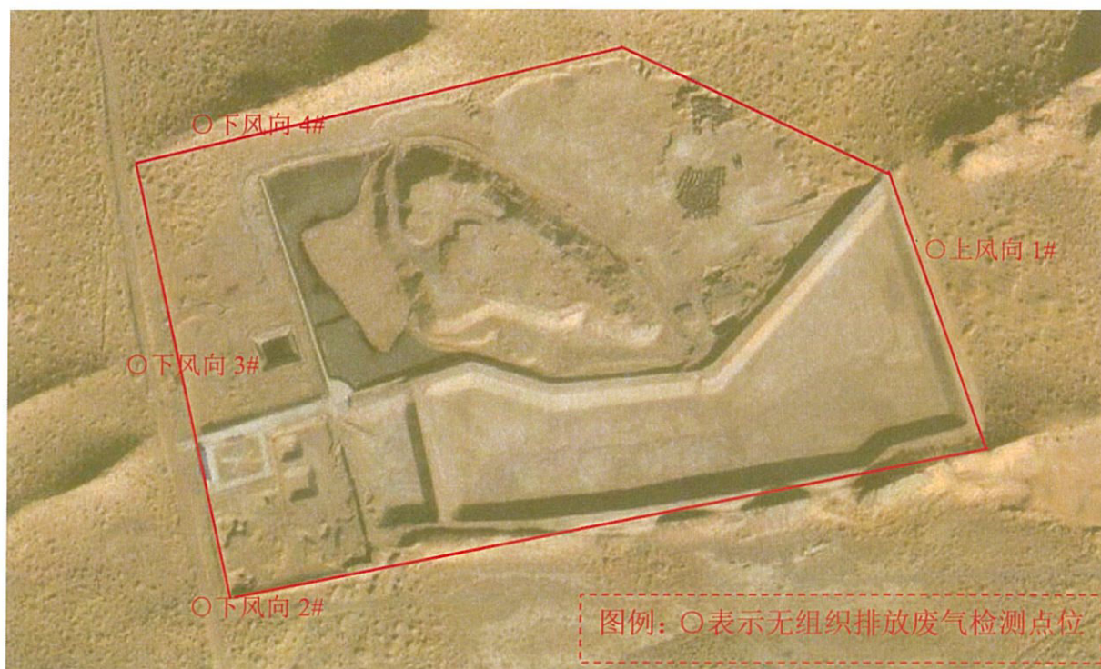
图 1-3 检测点位图 (2025 年 9 月 16 日)