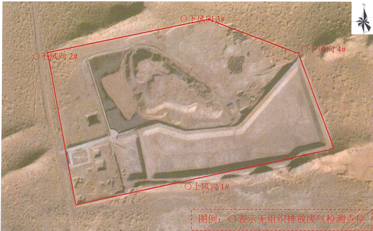
图 1-1 检测点位图 (2025 年 8 月 18 日)