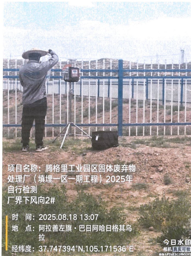
图 2 现场采样

样品采集、保存、运输和检测分析过程严格按照相关技术规范进行，满足要求(采样见图 2)。