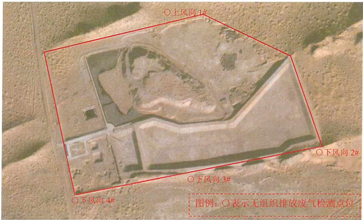
图 1-3 检测点位图 (2025 年 8 月 20 日)