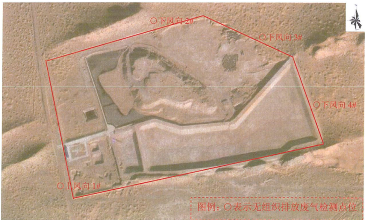
图 1-2 检测点位图 (2025 年 8 月 19 日)