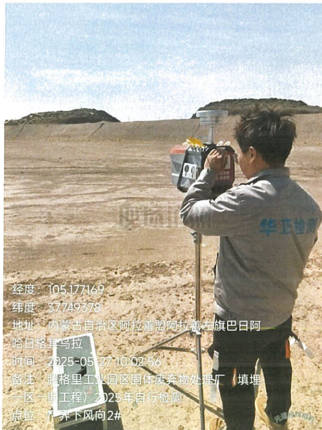
图 2 无组织排放废气现场采样

样品采集、保存、运输和检测分析过程严格按照相关技术规范进行，满足要求(采样见图 2)。