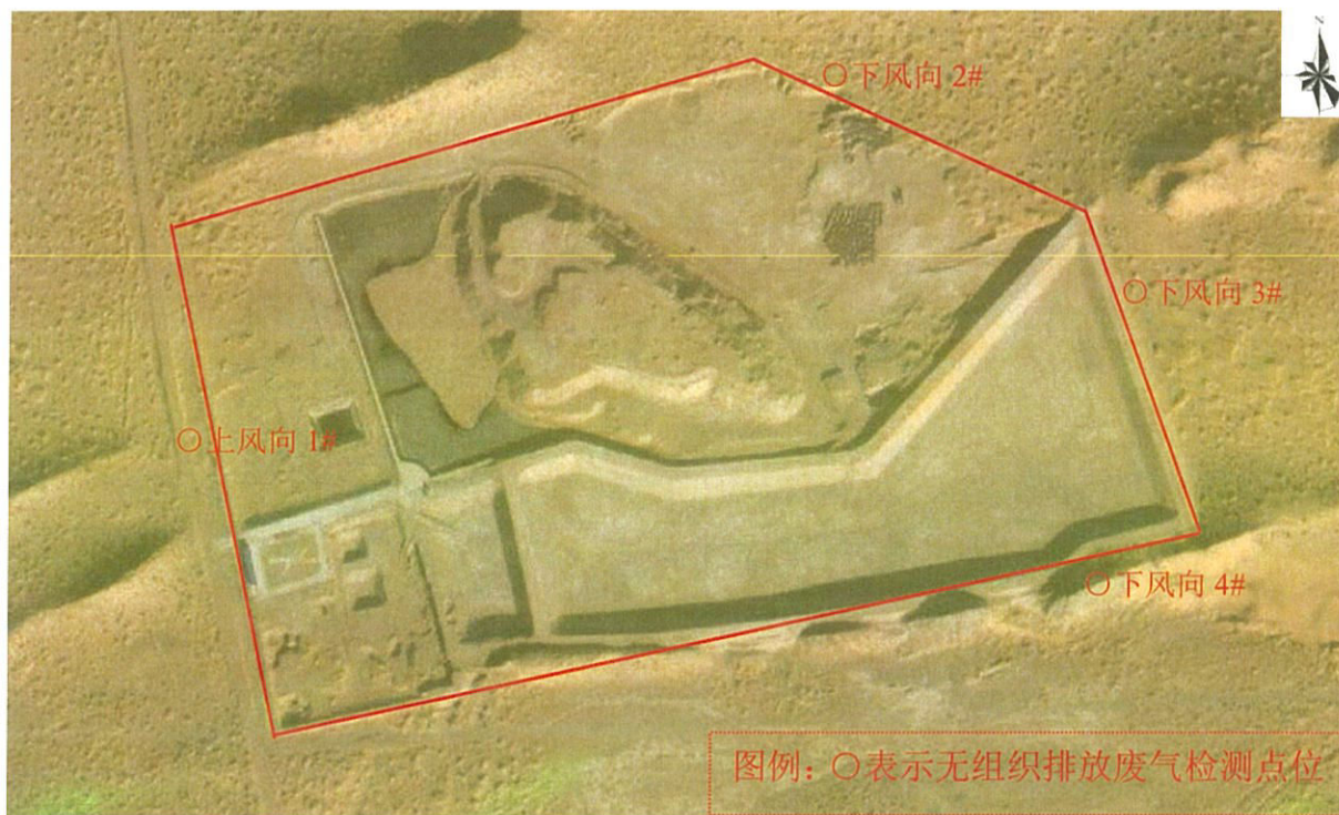
图 1-2 检测点位图(2025 年 5 月 27 日)