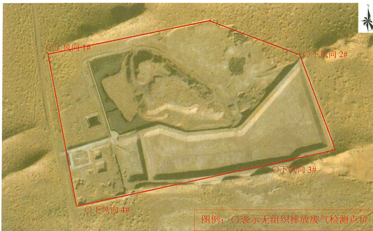
图 1-1 检测点位图