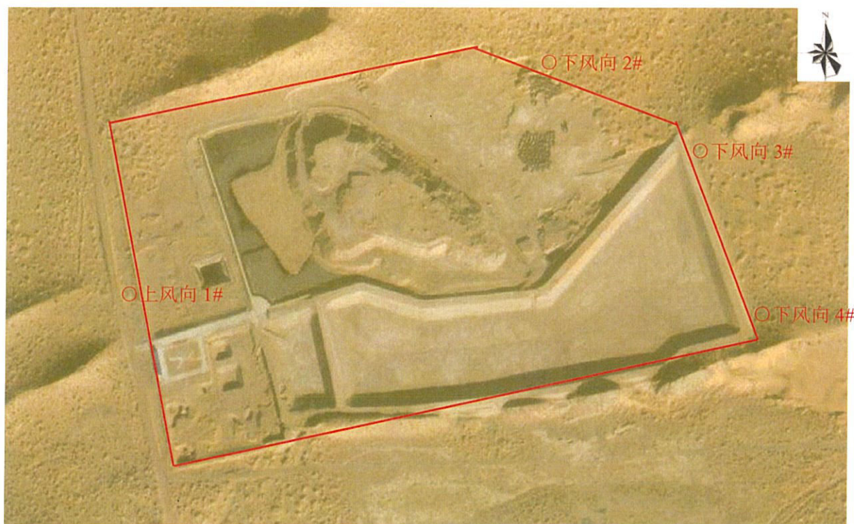
图 1 检测点位图