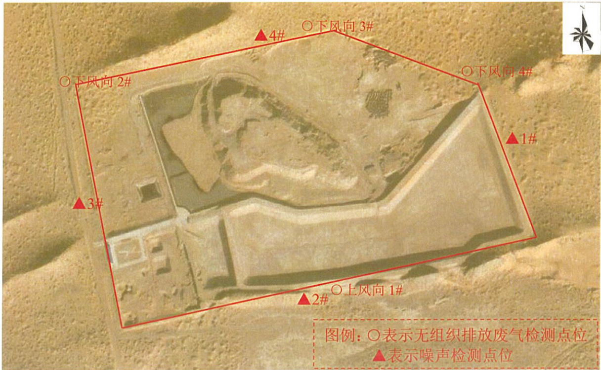
图 1 检测点位图