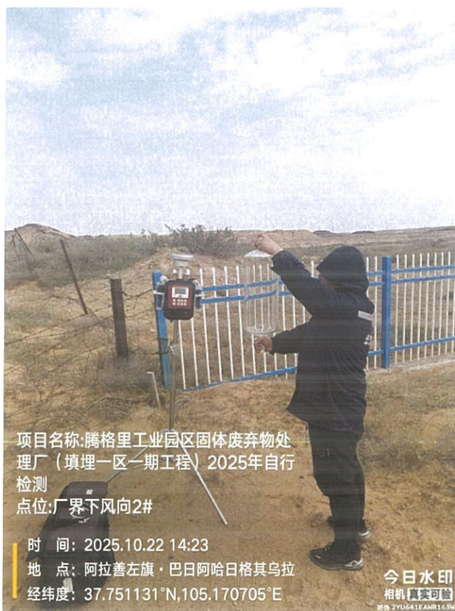
图 2 现场采样

样品采集、保存、运输和检测分析过程严格按照相关技术规范进行，满足要求(采样见图 2)。