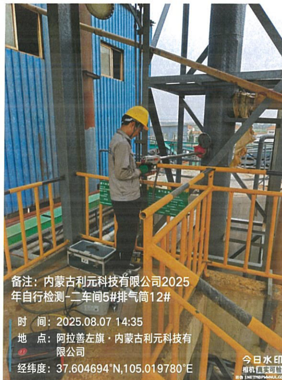
图 3 废气采样

样品采集、保存、运输和检测分析过程严格按照相关技术规范进行，满足要求(采样见图 3):