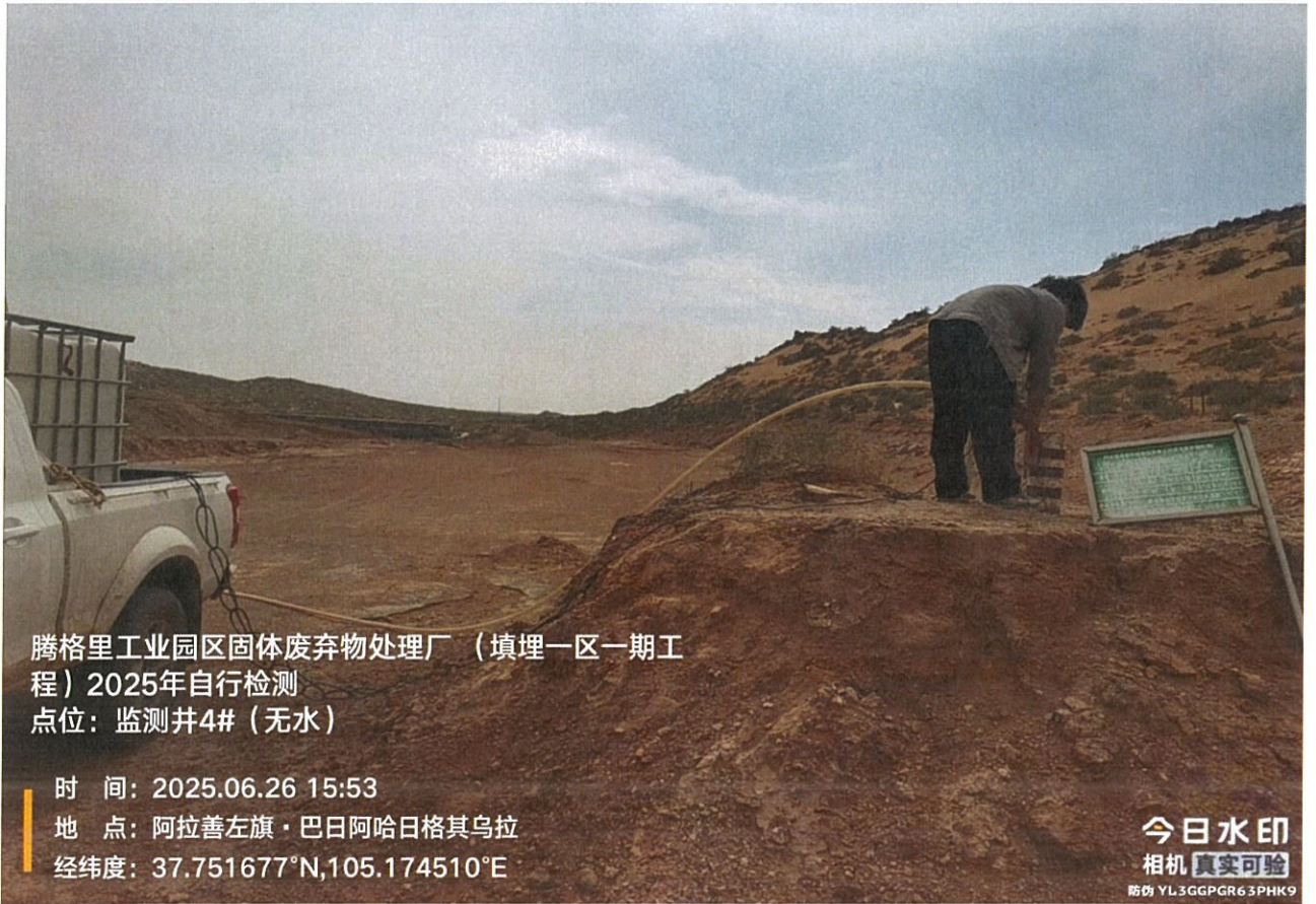
腾格里工业园区固体废弃物处理厂（填埋一区一期工程）2025年自行检测 点位：监测井4#（无水）

时间：2025.06.26 15:53 地点：阿拉善左旗·巴日阿哈日格其乌拉 经纬度：37.751677°N,105.174510°E