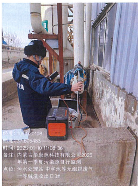
图 12-1 有组织排放废气采样

12.1 样品采集、保存、运输和检测分析过程严格按照相关技术规范进行，满足要求(采样见图 12-1)。