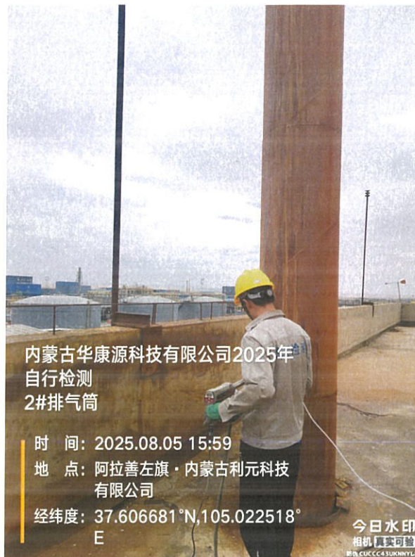
图 2 现场采样

样品采集、保存、运输和检测分析过程严格按照相关技术规范进行，满足要求(采样见图 2):